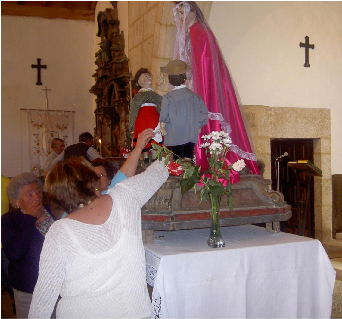
RITUAL DE CONTACTO COA ADVOCACIÓN DA VIRXE DAS VIRTUDES.