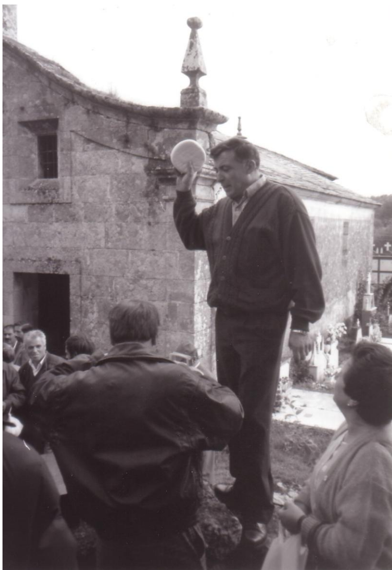
POXA DOS QUEIXOS NA FESTIVIDADE DA VIRXE DO LEITE.