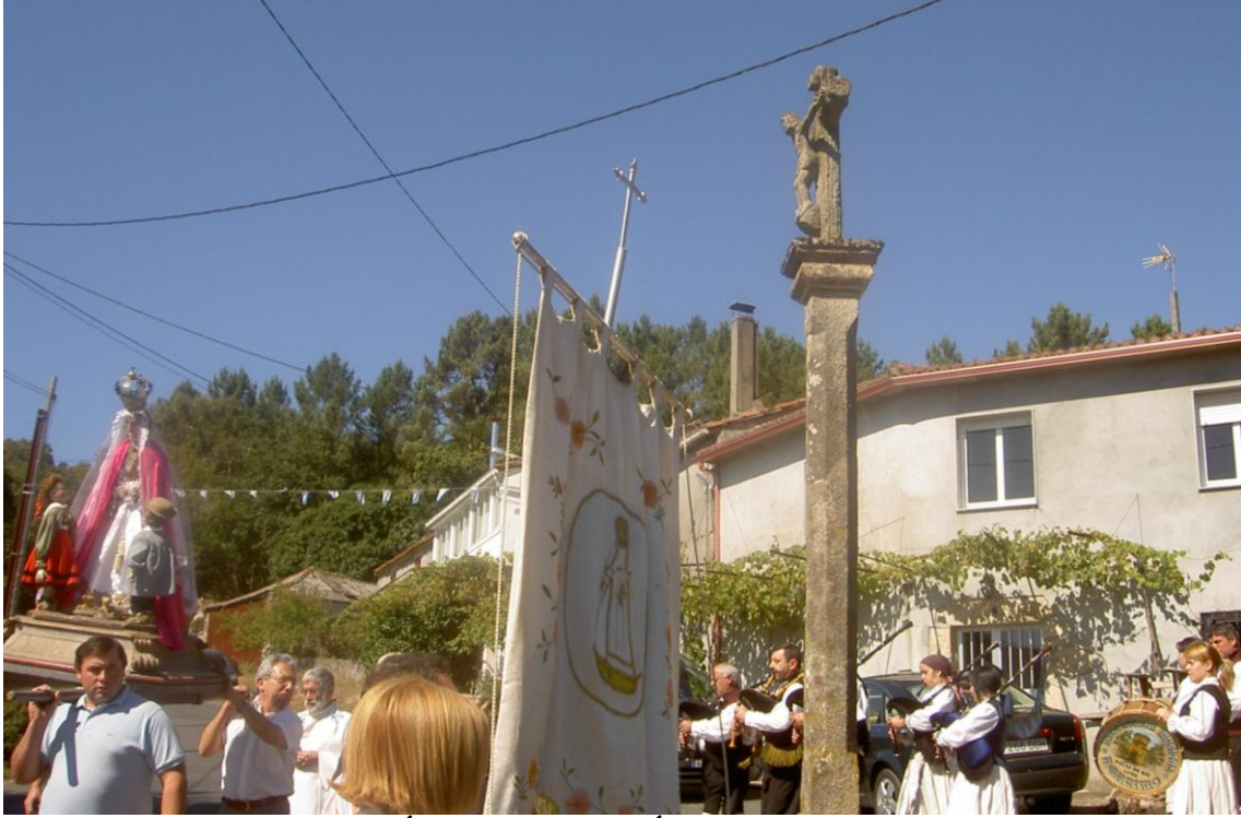
A PROCESIÓN DA A VOLTA Ó REDOR DO CRUCEIRO.