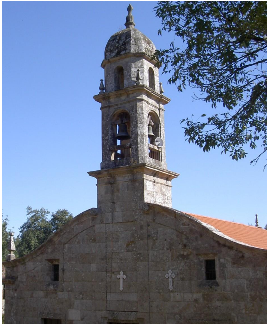
A TORRE DO SANTUARIO DE SAN BREIXO