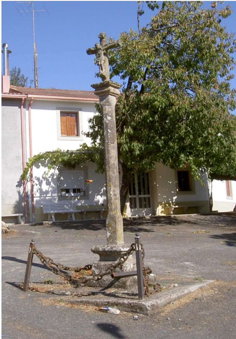
CRUCEIRO DE SAN BREIXO.