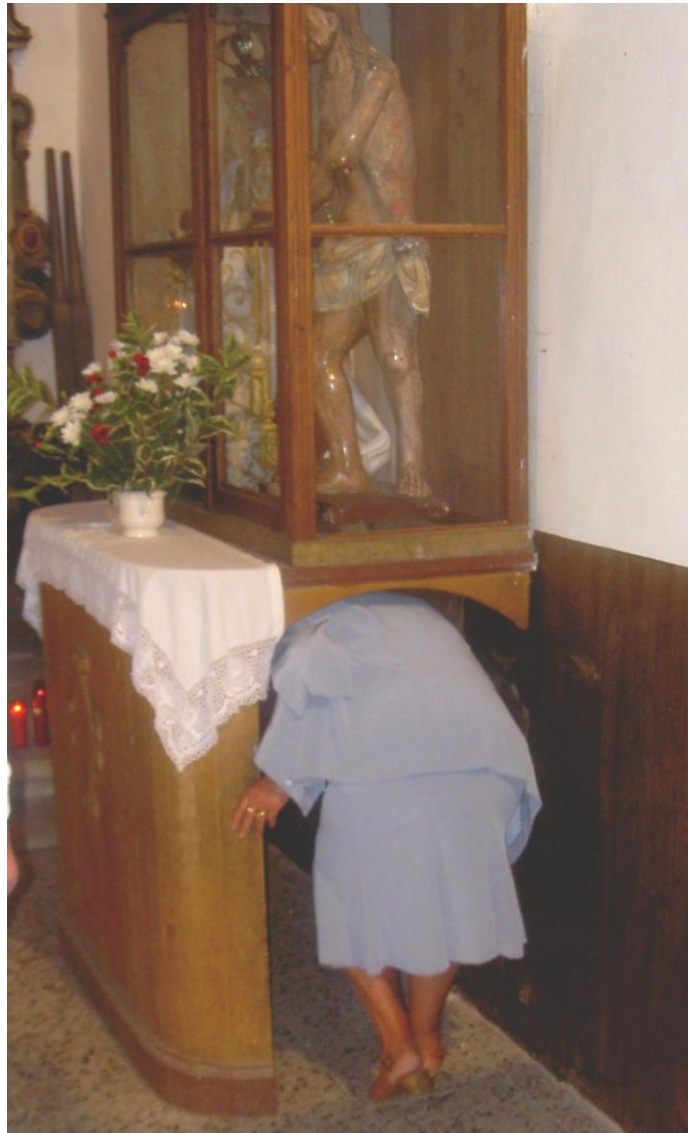
RITUAL POR BAIXO DAS ADVOCACIÓNS DO ECCEHOMO E A VIRXE DA LEITE