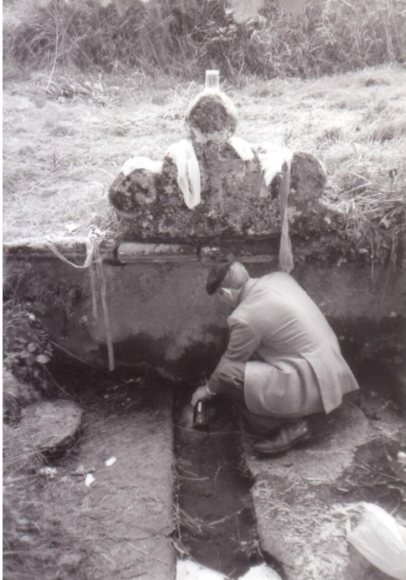
RITUAL NA FONTE DA VIRXE.