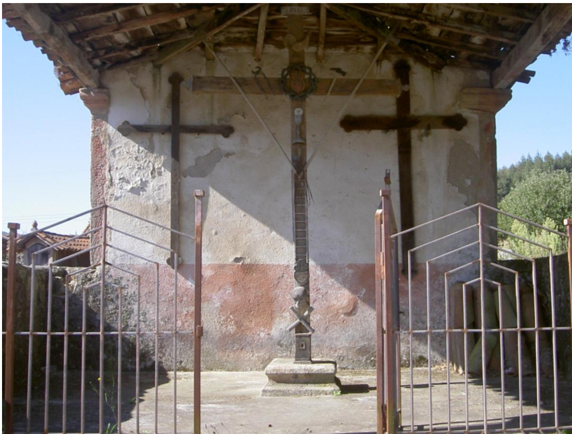
O ORATORIO DA SANTA CRUZ