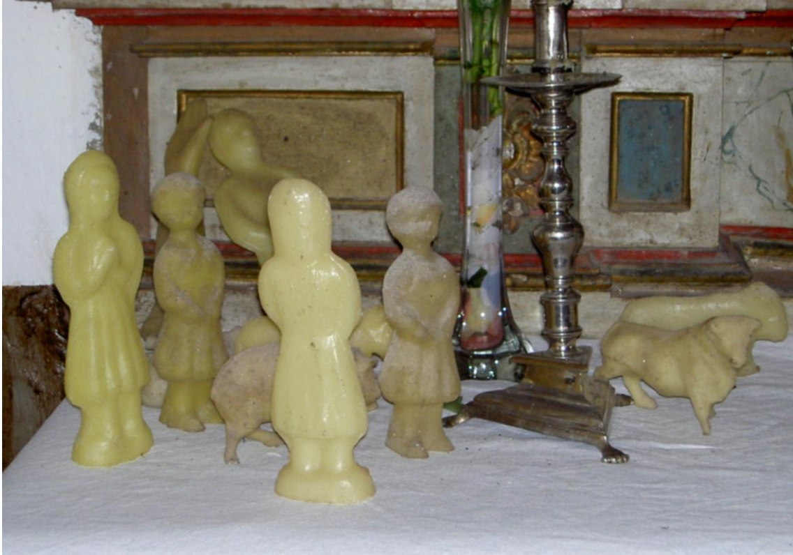
EXVOTOS DE CERA SIMBOLIZANDO FIGURAS HUMAS E DE ANIMAIS.