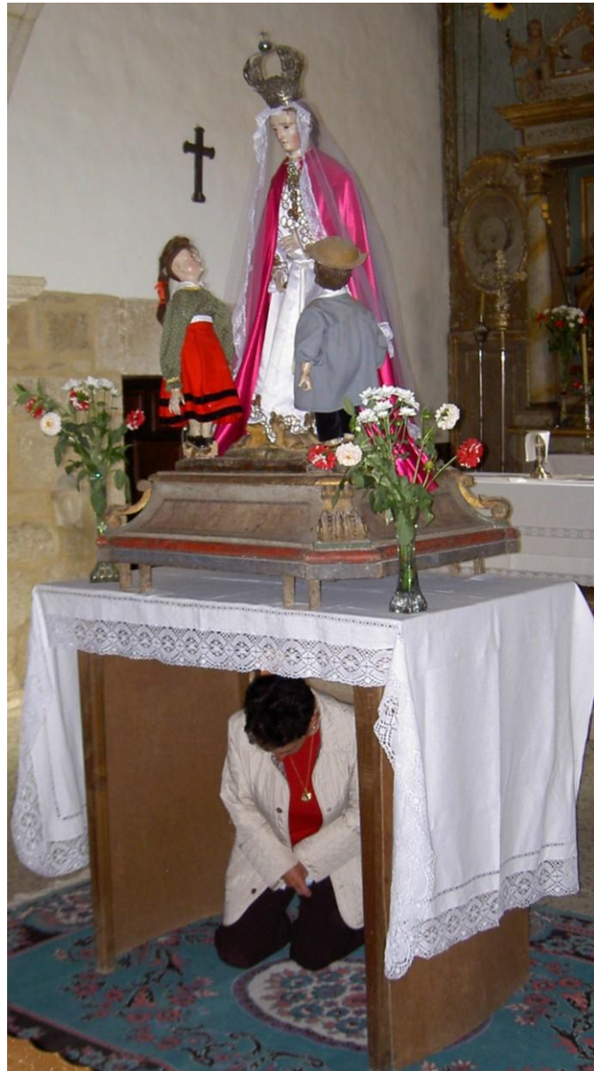
RITUAL POR BAIXO DA ADVOCACIÓN DA VIRXE DAS ANGUSTIAS