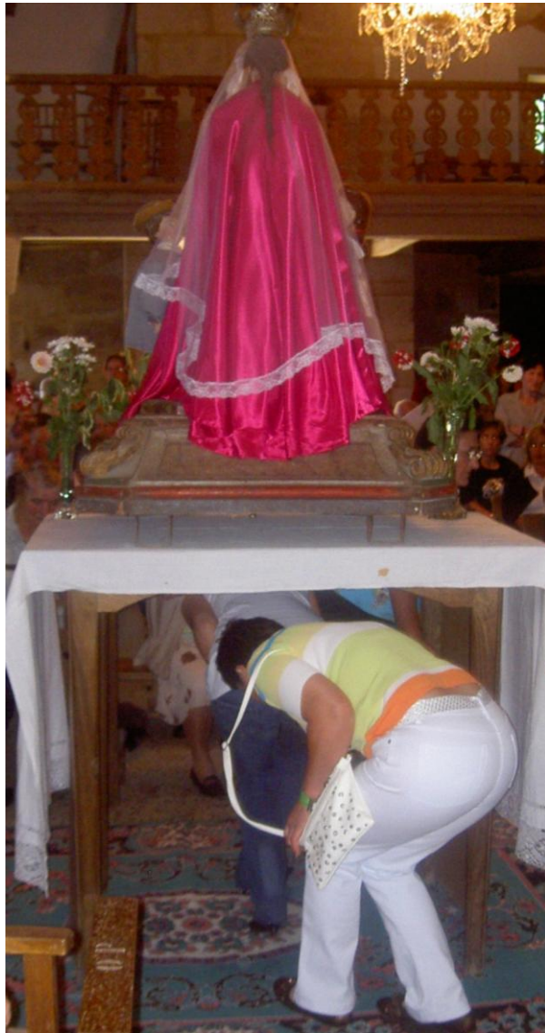
RITUAL POR BAIXO DA ADVOCACIÓN DA VIRXE DAS ANGUSTIAS.