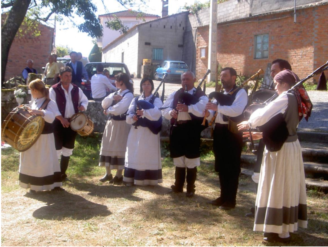
GRUPO FOLKLÓRICO QUE VAI A ACOMPAÑAR Á PROCESIÓN.