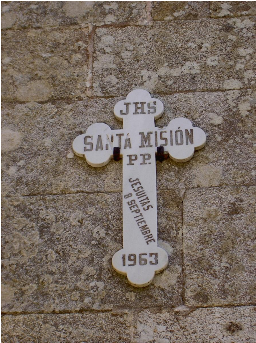
CRUZ DE MISIÓN. AÑO 1963.