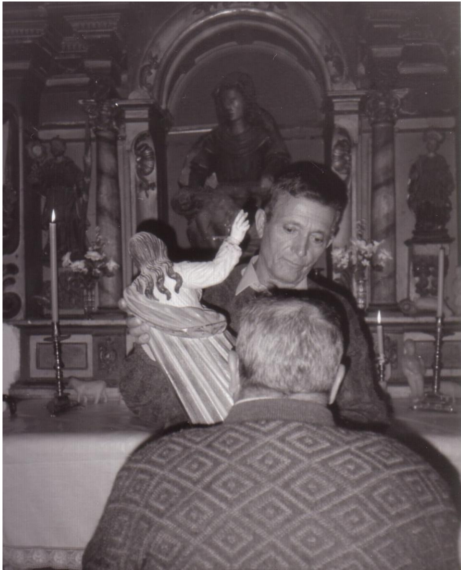
RITUAL DE POÑER O SANTO